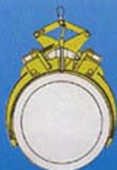
TYP II/RG 5,0 mit Greiferarm Typ 1500

Armpaar Typ 900 für Rohre von 700 - 1100 mm Außendurchmesser Armpaar Typ 1250 für Rohre von 1050 - 1480 mm Außendurchmesser Armpaar Typ 1500 für Rohre von 1300 - 1800 mm Außendurchmesser