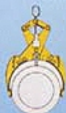
TYP I/RG 2,5 mit Greiferarm Typ 800

Armpaar Typ 500 für Rohre von 275 - 600 mm Außendurchmesser Armpaar Typ 800 für Rohre von 580 - 1000 mm Außendurchmesser